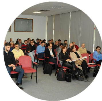
Sessão de abertura dos trabalhos 22/11/2017