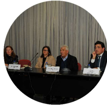
Sessão de abertura dos trabalhos 22/11/2017